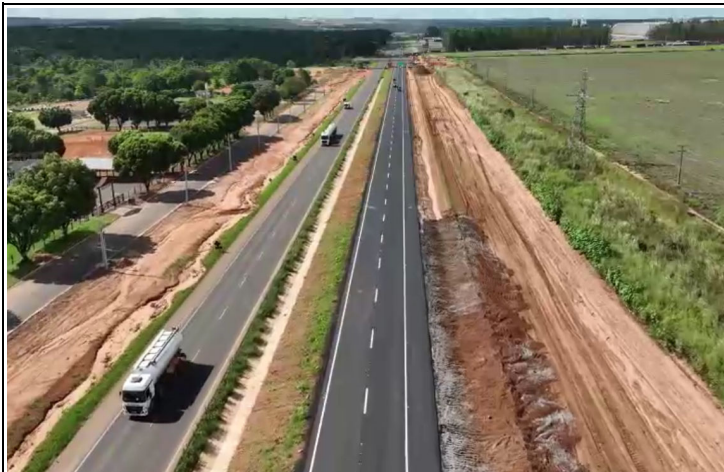
Localização Descrição BR-163/MT Duplicação