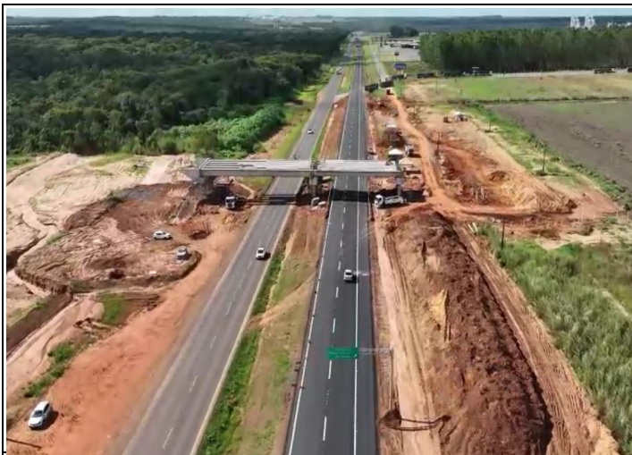
Localização Descrição BR-163/MT Duplicação