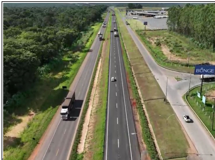
Localização Descrição BR-163/MT Duplicação