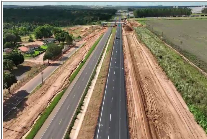
Localização Descrição BR-163/MT Duplicação