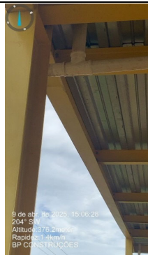
9 de abril de 2025, 16:06:26 204° SW Altitude: 376.2 m Rapidez: 3.4 km/h BR CONSTRUÇÕES