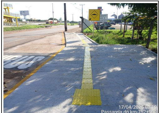
17/04/2025 08:19 Passarela do km-752+900