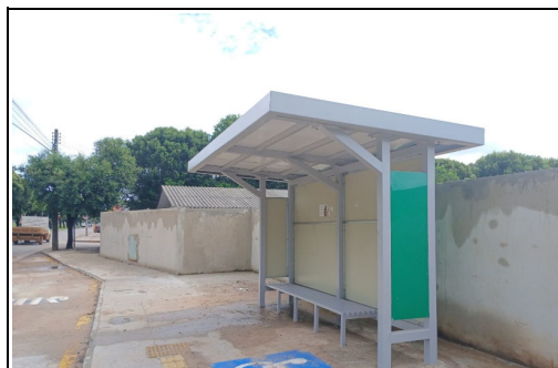
Norte Descrição BR 163/MT KM 752+900 - Sorriso Retoque na Pintura da Estrutura dos Abrigos.