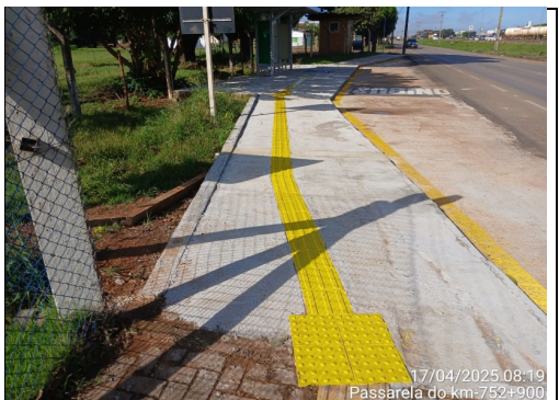
17/04/2025 08:19 Passarela do km-752+900