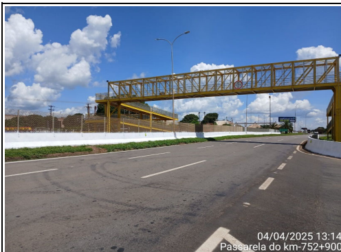
Localização Descrição BR 163/MT KM 752+900 - Sorriso Pintura das Barreiras Rígidas.