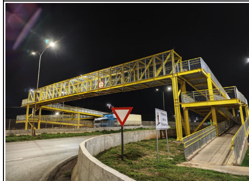
Localização Descrição BR 163/MT KM 752+900 - Sorriso Iluminação da passarela