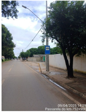
09/04/2025 14:29 Passarela do km-752+900