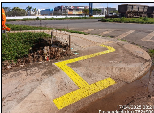
17/04/2025 08:21 Passarela do km-752+900