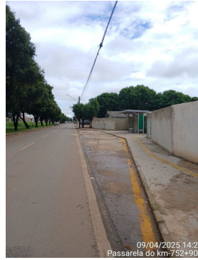
09/04/2025 14:28 Passarela do km-752+900