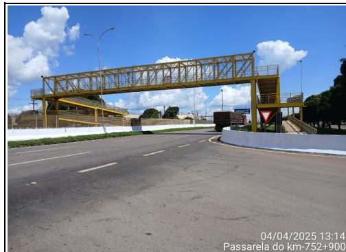
Localização Descrição BR 163/MT KM 752+900 - Sorriso Pintura das Barreiras Rígidas.