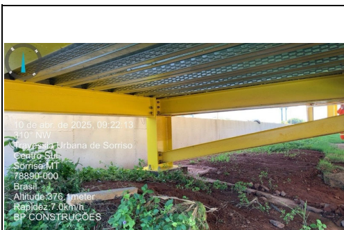
Localização Descrição BR 163/MT KM 752+900 - Sorriso Retoque na Pintura da Estrutura da Passarela.